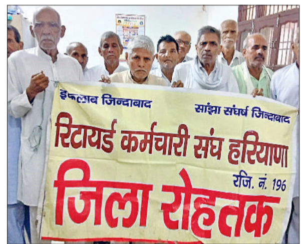
रोहतक। मांगों को लेकर प्रदर्शन करते रिटायर्ड कर्मचारी संघ के सदस्य।