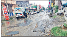
झंझर | हल्की बारिश के बीच गुजरते हुए वाहन।