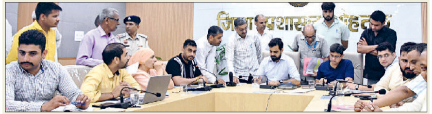
रोहताक। समाधान शिविर में लोगों की समस्याएं सुनते अतिरिक्त उपायुक्त।