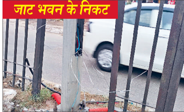
जाट भवन के निकट

मिले। शीला बाईपास से दिल्ली बाईपास के बीच करीब 78 पोल में से 69 पर पैनेल बॉक्स ही नहीं