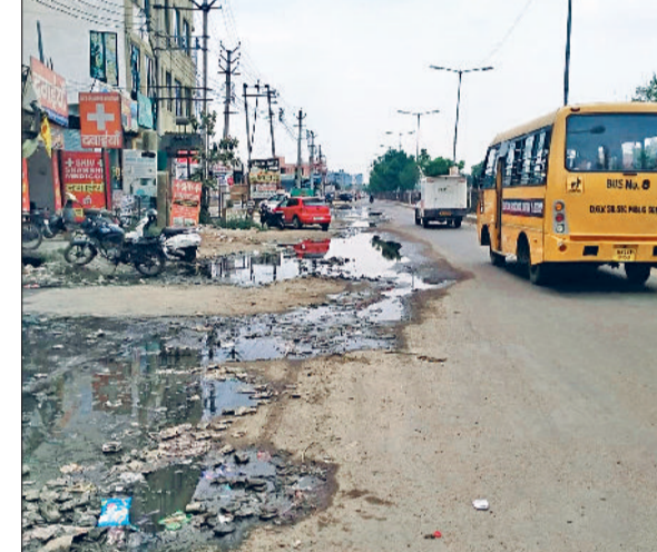
रोहतक। अस्थल बोहर कालोनी में बाबा मस्तनाथ विवि के सामने सड़क पर बहता नाले का गंदा पानी।

मस्तनाथ यूनिवर्सिटी के सामने से गुजरने वाले हजारों वाहन उड़ा रहे लोगों के ऊपर गंदे पाने के छींटे