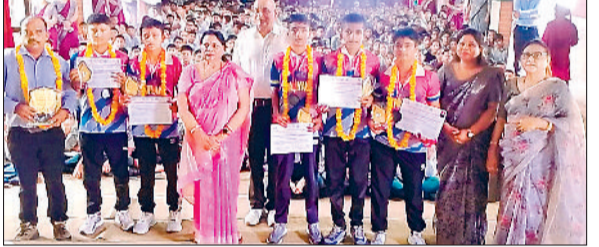
हराकर सेमी फाइनल में प्रवेश किया, लेकिन सेमीफाइनल में दिल्ली की टीम से 2-1 से हार गए। ग्रीनलैण्ड पब्लिक स्कूल में एक भव्य कार्यक्रम का आयोजन किया गया। इस दौरान