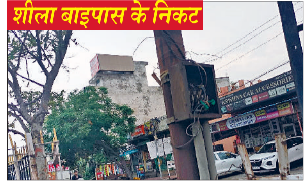
शीला बाईपास के निकट